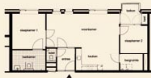
PLATTEGROND WONINGTYPE E