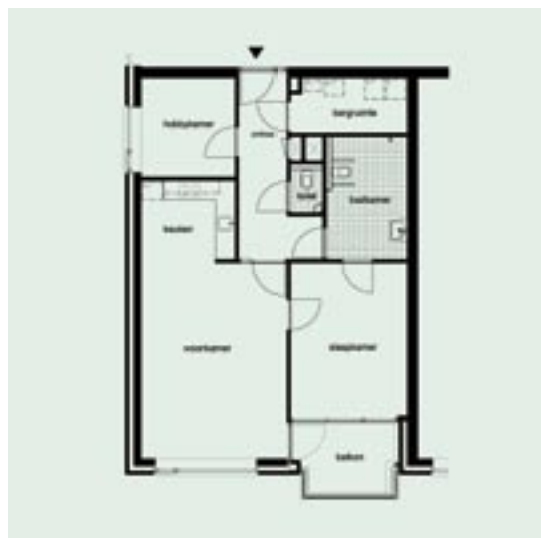
PLATTEGROND WONINGTYPE A